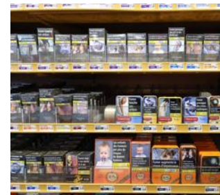
Le prix du paquet de cigarettes doit augmenter au 1 er juin.

À l'occasion de la Journée mondiale sans tabac ce vendredi un rapport préconise de continuer à augmenter les taxes sur le tabac. Une mesure qui semble efficace : les plus fortes baisses de consommation sont corrélées aux plus fortes hausses de tarifs.