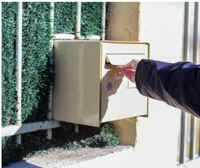
Le prix repère de vente de gaz naturel va encore augmenter en juin.

À partir du 3 juin, la production, la vente et l'usage de nouveaux composés dérivés du cannabis seront interdits en France en raison de « risques » pour la santé. Les molécules concernées sont les cannabinoïdes hémisynthétiques H4-CBD et H2-CBD et des cannabinoïdes purement synthétiques. Vendus notamment sur inter-