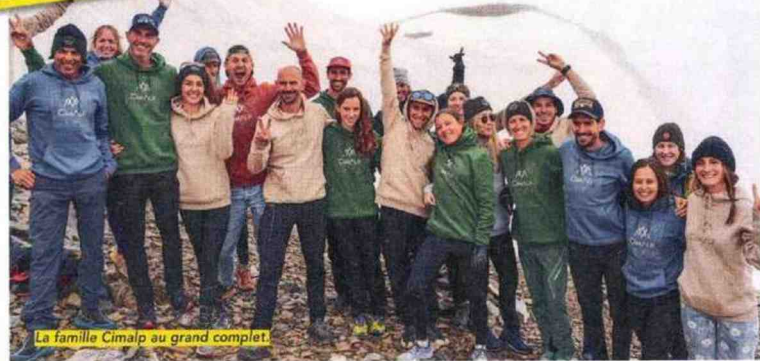
La famille Cimalp au grand complet

de Cimalp : « J'ai été contacté il y a 4 ans par une responsable de Tignes, en quête d'un partenaire français pour leur événement. J'avais déjà couru ici pour me rendre compte, et nous avons pensé pertinent de devenir leur partenaire. Tignes est une station fleuron des Alpes françaises, portant une forte démarche de développement. Le territoire est identifié montagne, randonnée, trail, VTT. De plus, l'événement est organisé de main de maître par Tignes Développement, structure d'animation de la station. Ce partenariat de 3 ans se termine avec cette édition 2024. Nous allons faire le bilan de ces 3 années pour envisager la suite. Tignes est notre partenariat le plus fort, avec le naming de l'événement ! C'est ici que nous investissons le plus. »