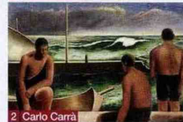
2 Carlo Carrà