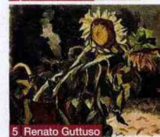
5 Renato Guttuso

Gli importi sono espressi in euro e sono comprensivi dei diritti d'asta. © Riproduzione riservata