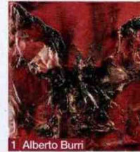
1 Alberto Burri