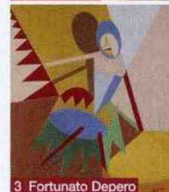
3 Fortunato Depero