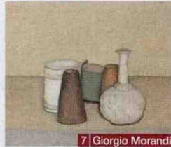
7 Giorgio Morandi