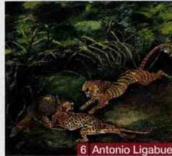
6 Antonio Ligabue