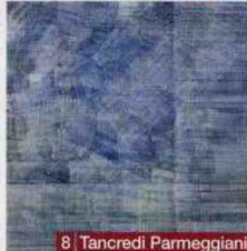
8 Tancredi Parmeggiani